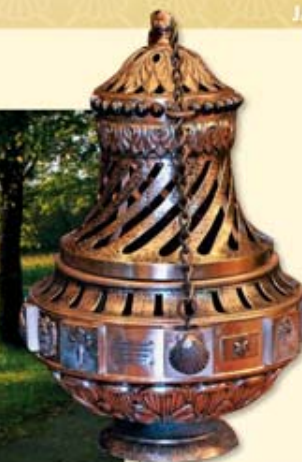
Das prächtige Wehrauchfass »Botafumeiro« füllt an hohen Festtagen die Kathedrale von Santiago mit seinem Duft.