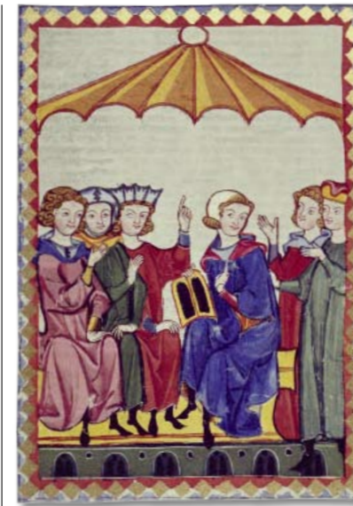
Rund 100 Jahre nach seinem Tod wurde »Meister Gottfried« in der Manessischen Handschrift als gefeierter Dichter dargestellt.

Die geheime und stets gefährdete Liebe und ihre tragische Verstrickung erfährt immer wieder neue Varianten der künstlerischen Darstellung in verschiedenen Bereichen. So ist es nicht erstaunlich, dass das Thema auch den Zugang in die Comic-Welt gefunden hat. Die Geschichte von Tristan und Isolde hat an Faszination nichts eingebüßt und zählt nach wie vor zu den großen Liebestragödien der Weltliteratur. ■ ek